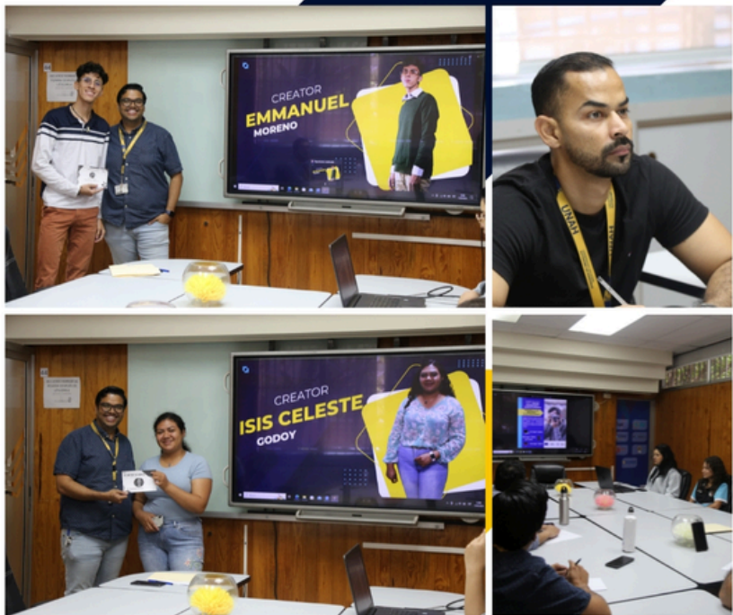
TERCERA EDICIÓN DEL WAKA FEST III PAC 2024